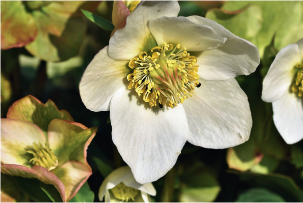
Christrose