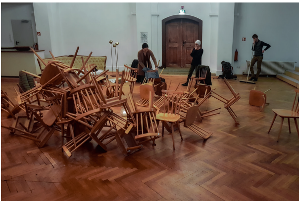
Künstlerische Kongressvorbereitung: Stuhlinstallation

Anfang Februar trafen sich die Künstler, die es sich zur Aufgabe gemacht haben, das Kongress-Festival künstlerisch zu begleiten. Im Mittelpunkt der Arbeit stand die Frage nach den „drei Engelmotiven“, die von Steiners Vortrag „Was macht der Engel im Astralleib“* entlehnt, als Gestaltungsmotiv für das künstlerisch Performative und Raumgestaltende beim Kongress-Festival Pate stehen. In diesem werden die Wirkbereiche der Engel für das Mitmenschliche im geschwisterlichen Sinne, die Gestaltung der Beziehung der Menschen aufgrund ihrer Menschenwürde unabhängig von Herkunft, Religion, Geschlecht, etc. und die Inspirationsquelle für unsere persönliche Entwicklung beschrieben.