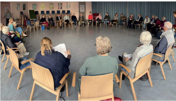
Zweigtag 2022 in Kassel | Foto: A.Fecke

Diese Frage war vor drei Jahren der Anlass, um mit Menschen aus den Zweigen und Gruppen in ein Gespräch zu kommen, um von ihren Sorgen und Nöten zu hören, aber auch von ihren verschiedenen Versuchen, wie Anthroposophie erarbeitet werden kann. Seitdem treffen wir uns jährlich. In diesem Jahr haben wir uns am 29. und 30. Oktober in Kassel zusammengefunden. 36 Menschen aus fünfzehn verschiedenen Orten in Deutschland, Holland und der Schweiz hatten an diesen Tagen die Möglichkeit, von den verschiedenen Arbeitsweisen zu hören, die in den anderen Zweigen oder Gruppen der