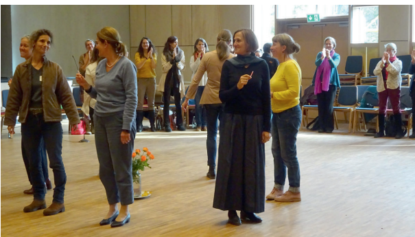
Ita-Wegman-Kongress: Applaus für die Vorbereiterinnen

Vom 21. bis 23. Oktober 2022 hat der Kongress „Ita Wegman - freier - weiblicher - fortschreiten“ der „Gesellschaft Anthroposophischer Ärztinnen und Ärzte“ in der Freien Waldorfschule Kassel stattgefunden. Etwa 150 Frauen aus Heilberufen – Ärztinnen, Krankenschwestern, Therapeutinnen, Hebammen, Apothekerinnen – aus Deutschland, Österreich und der Schweiz sowie drei Ärzte nahmen teil. Nur zu Frauenthemen oder von Frauen gab es Workshops, Vorträge, Plena und Begleitveranstaltungen (Singen, Bewegen nach „Spacial dynamics“, Meditation). Als