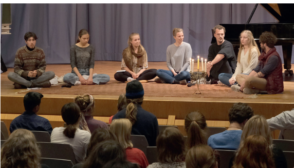
Podiumsgespräch auf der bildungsART 22

Wie können wir Schritte in die Zukunft machen, wenn alles in der Welt nicht mehr zu tragen scheint - die beruflichen Traditionen, der Familienzusammenhalt oder eine als sinnentleert erscheinende Bildungslandschaft? Vor dieser Frage standen viele junge Menschen vor 100 Jahren und haben von Steiner in mehreren Vorträgen den sogenannten „Jugendkurs“ (GA 217) an die Hand bekommen. Erstaunlich ähnlich ist auch das heutige Lebensgefühl vieler junger Menschen, 100 Jahre später! Auf der bildungsART 22, einer intensiven