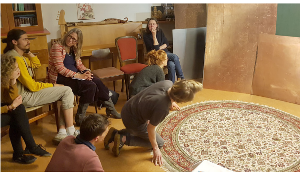
Im „Salon Anthroposophia“

Schon zum dritten Mal lädt der neu eröffnete „Salon Anthroposophia“ ein vornehmlich junges Publikum in den „Ort der Begegnung“ in Witten ein, mit dem Ziel Anthroposophie erlebbar zu machen.