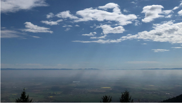
Blick vom Odilienberg

Die „Société Anthroposophique en France“ tagte vom 21. bis zum 23. April am elsässischen Mont Sainte-Odile. 120 Mitglieder versammelten sich an diesem über Landesgrenzen hinweg bekannten und bedeutsamen Ort zur Jahres- und Generalversammlung. Wenn man bedenkt, dass die Mitgliedschaft der französischen anthroposophischen Gesellschaft 1.200 Menschen umfasst, ist das ein beachtliche Quote.